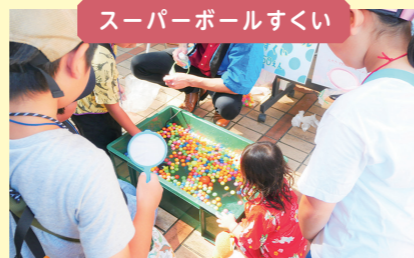
スーパーボールすくい

のげ青の畑でできた赤しそや梅、ハーブなどを使った手作りシロップをかけた優しい味のかき氷。暑い日にピッタリでした！