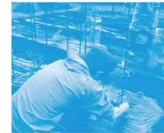
収穫した野菜は、ゆくゆくはのげ青カフェの素材になるかも...!!

今年ものげ青ファームを始めます!経堂から来た若者と一緒にトマト・ナス・きゅうり、かぼちゃの苗の植え付けをしました。のげ青に集まってくる高校生が植えさせやえんどうが次々と実をつけていたり、先日小学生たちが植えたカブたちが芽を出し始めていたり植物の生命力を感じながらの畑作業になりました。まだ2畝(うね)余裕があるのでのげ青ファームで何か育てたい!という方ぜひお待ちしております!