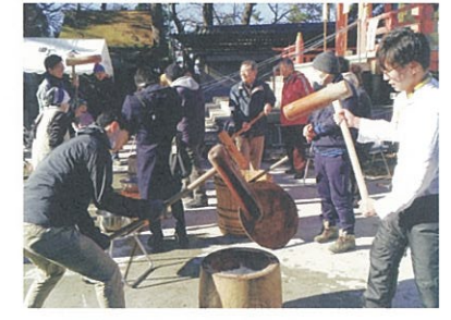
上/玉川台児童館主催のチャオチャオ児童館祭りに参加した様子。下/野毛六所神社でのもちつきの様子。